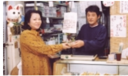
おかずの店かのう ■栄町市場内 098-884-3723 10時～20時頃 日曜日定休

栄町の顔ともいえるべき、創業五十一年のお惣菜屋さん。「安心しておいしく食べてもらいたいから」と、できあいの冷凍食品は使わず全て手作りにこだわり、お惣菜でありながら家庭の温もりをも味わえる評判。大道中央病院売店でもそのこだわり弁当を売っていて、職員や見舞い家族らに好評だ。盛り合わせ弁当の他、スタミナトンカツやマゴロカツなどパワー食が人気。プルツモチツとした食感と香ばしさのじーまーみ豆腐は自慢の一品。その姉妹品ともいえる、身体にやさしい素材を使ったウツチン・パセリ・紅イモ・イカ墨豆腐もあり、ちよっとした栄町の話の品だ。