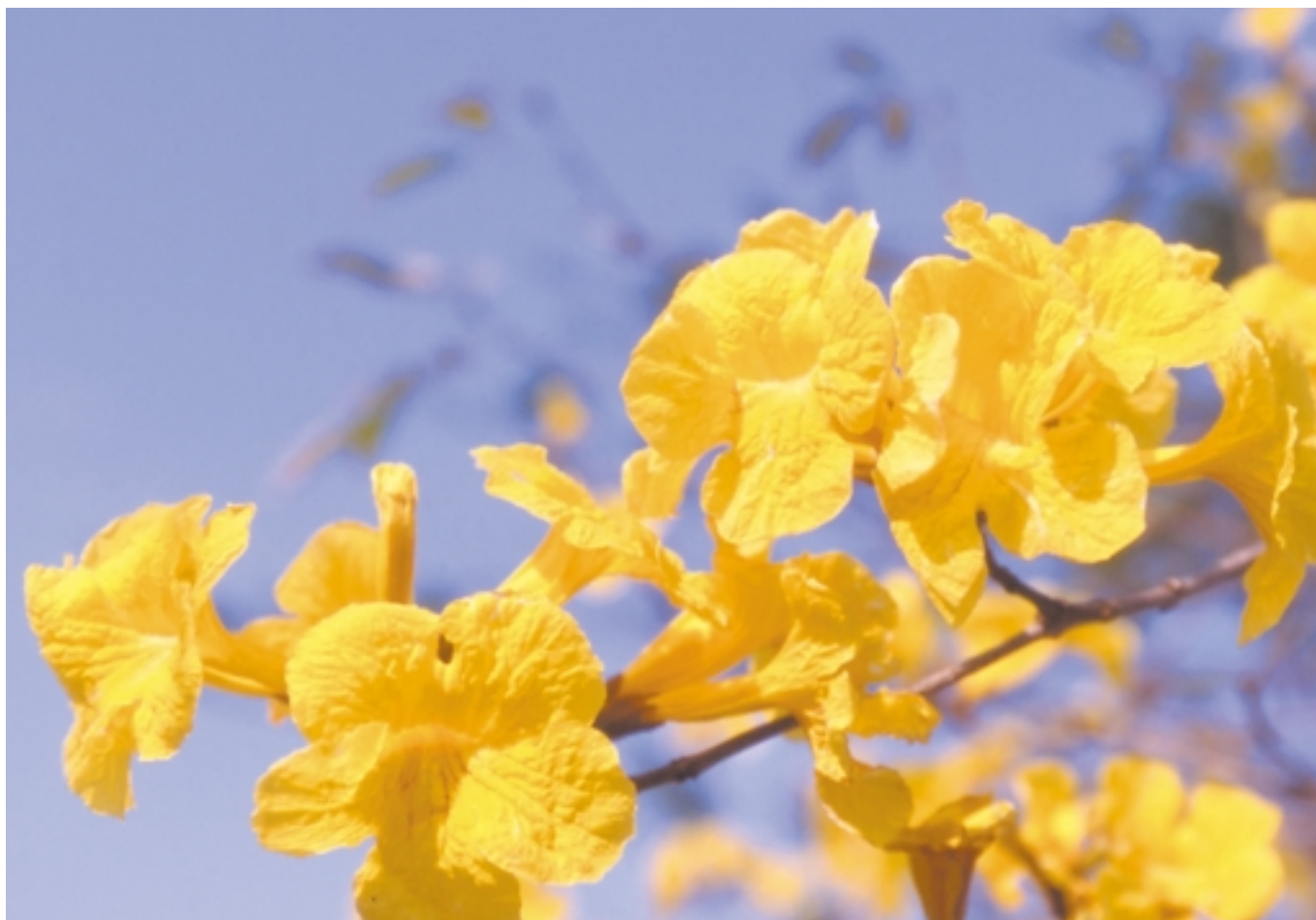
イッペイ/澄んだ青空に映えるイッペイの花。鮮やかに咲き誇るこの時期は、寒さも少しずつ和らいできます。うりずんの頃を教えてくれる花のひとつです。